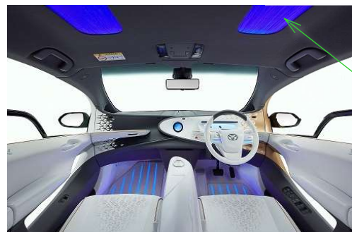
トヨタの未来志向型コンセプトカー「LQ」（東京モーターショー2019より）